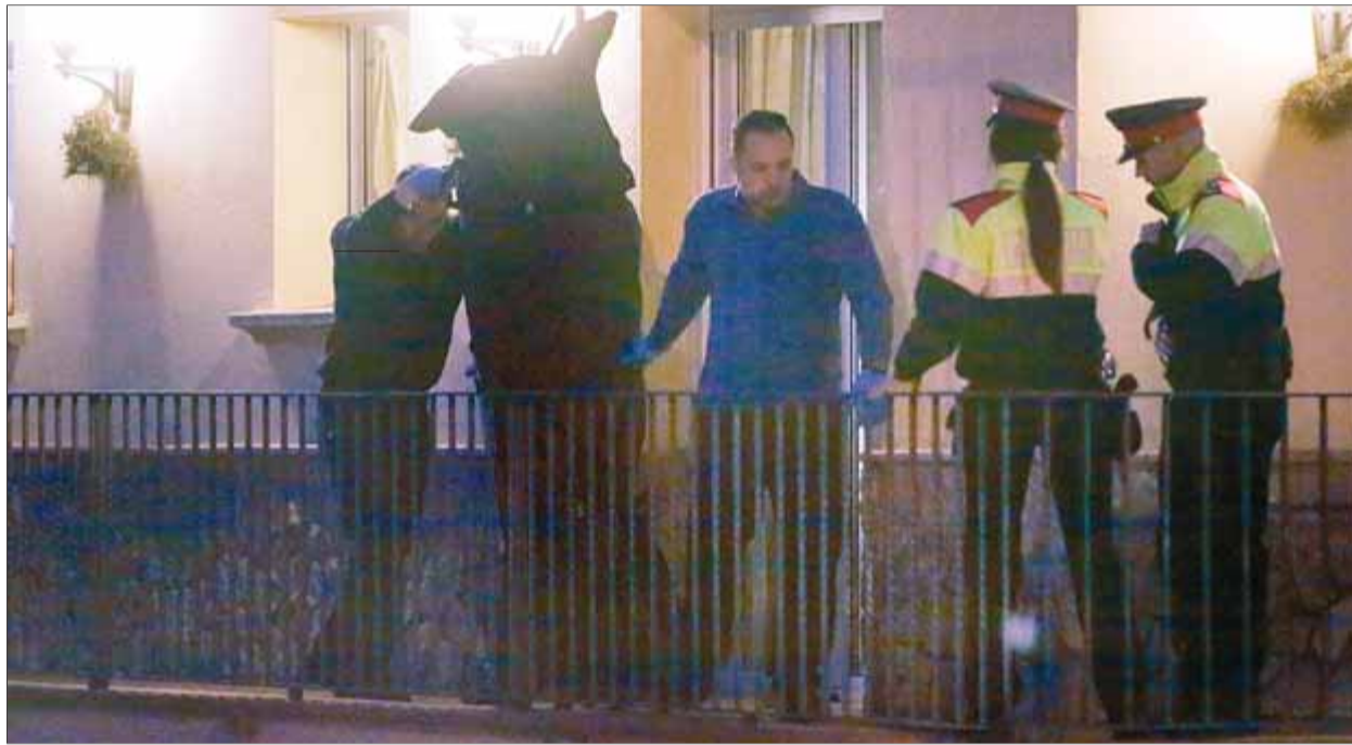
Els serveis funeraris enduent-se el cadàver del domicili, ahir al vespre a Santa Coloma de Farners

Passada una estona es van sentir diversos trets i van començar els avisos a la policia. Els serveis d'emergència van fer un ampli desplegament i van