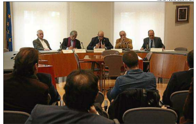
La presentació del seminari d'urbanisme de Lloret.

Tot i que la previsió de construcció de parc es preveia per a finals del 2015, finalment es començaria a finals del 2016, de manera que l'obra podria estar acabada a finals de 2019, generant –durant els treballs– entre 15 i 20 llocs de treball.